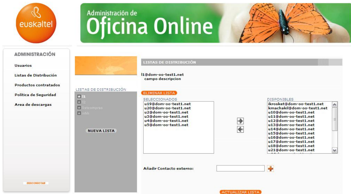
Ilustración 11: Listas de Distribución.

La opción Listas de Distribución permite crear listas de usuarios internos con el fin de que un mail dirigido a esta lista se distribuya a todos ellos.