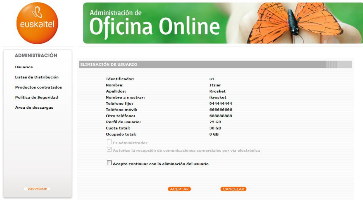
Ilustración 10: Borrado de usuario. Paso2.

Tras realizar dicha acción se muestra una pantalla de confirmación de la eliminación de la cuenta donde se muestran los datos de la misma para identificarla de manera inequívoca.