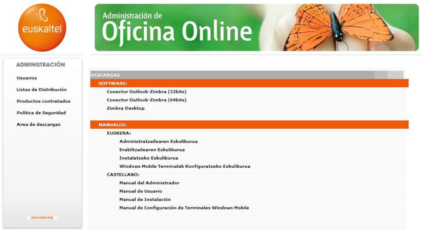
Ilustración 16: Área de descargas

Desde esta opción se podrá descargar el conector de Zimbra para Outlook así como el cliente Zimbra Desktop.