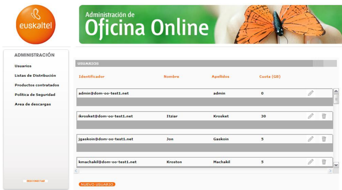
Ilustración 2: Administración de Oficina Online

Una vez registrado correctamente en la Consola de Administración, el Administrador accede a la Administración de Oficina Online: