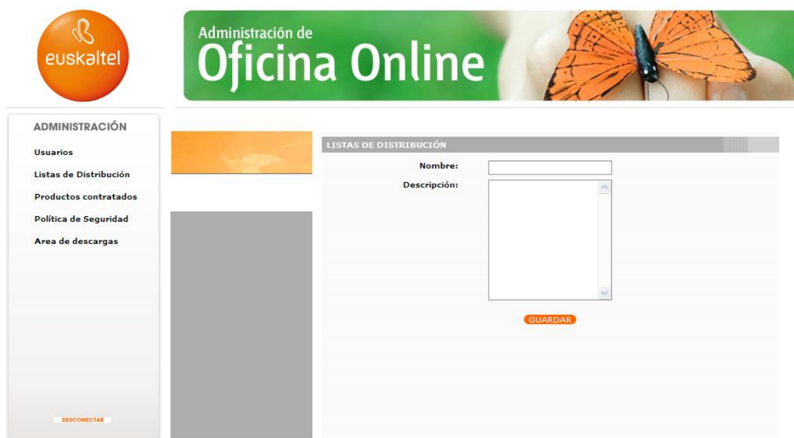
Ilustración 12: Añadir nueva Lista de Distribución.