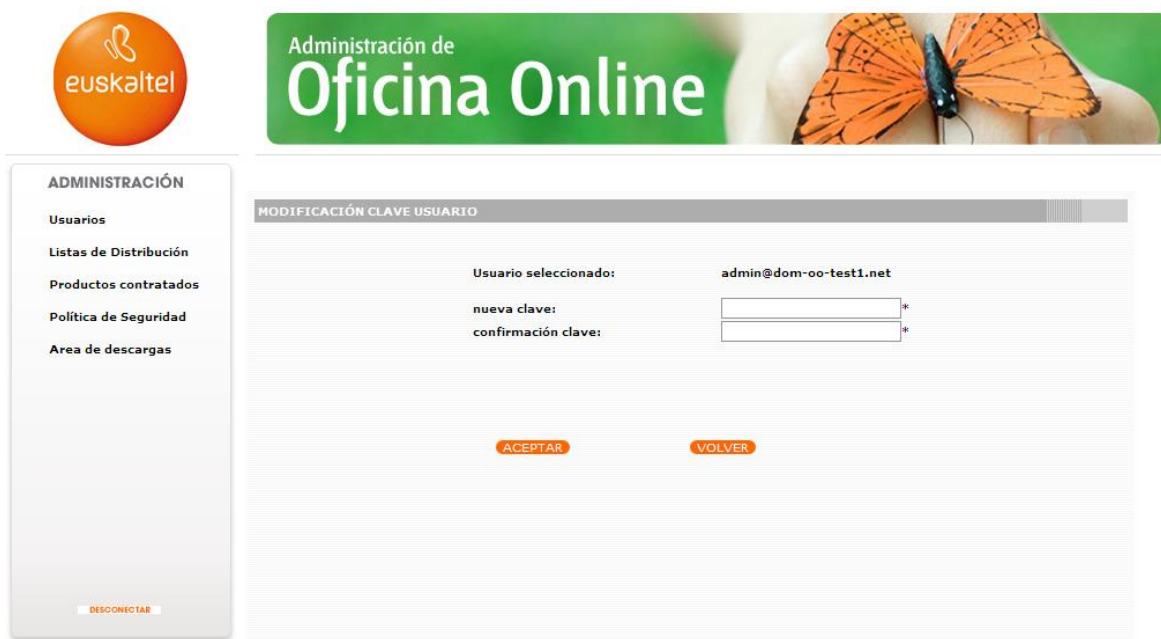
Ilustración 3: Modificación clave del Administrador

La clave de acceso del Administrador Principal se puede modificar a través de la Consola de Administración. Desde el listado de usuarios, basta con pinchar en el identificador del Administrador Principal para acceder a la pantalla de modificación de la clave.