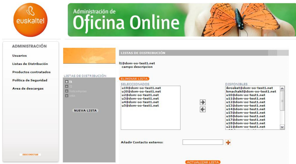
Ilustración 13: Añadir/eliminar usuarios de una Lista de Distribución.

Finalmente pinchamos en el botón ACTUALIZAR LISTA para aplicar los cambios realizados.