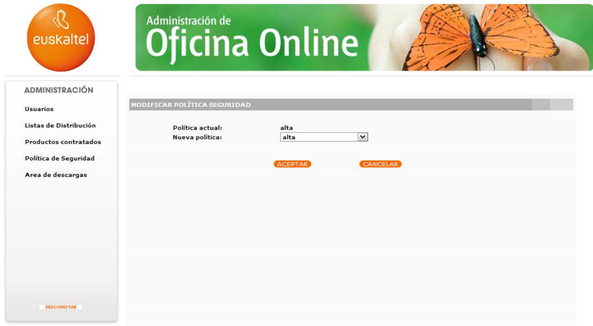
Ilustración 15: Añadir/eliminar usuarios de una Lista de Distribución.