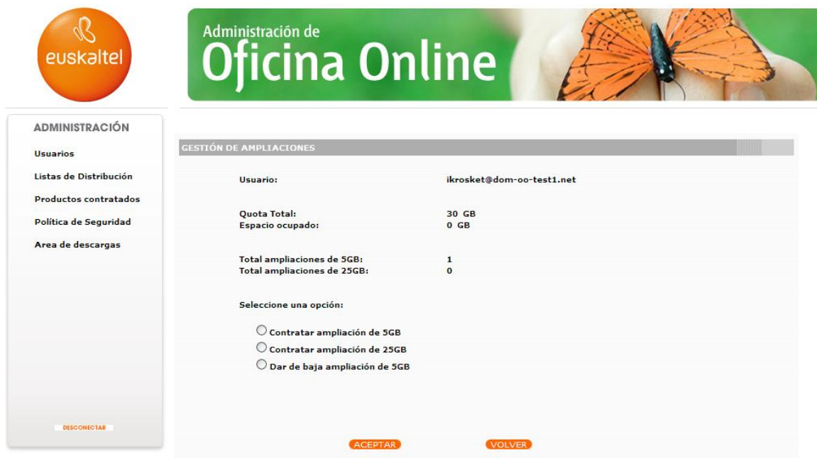
Ilustración 8: Ampliaciones

Pulsando en “Ampliaciones” se accede a la gestión de las ampliaciones asociadas a la cuenta seleccionada. En este apartado podrá añadir o eliminar ampliaciones para la misma.