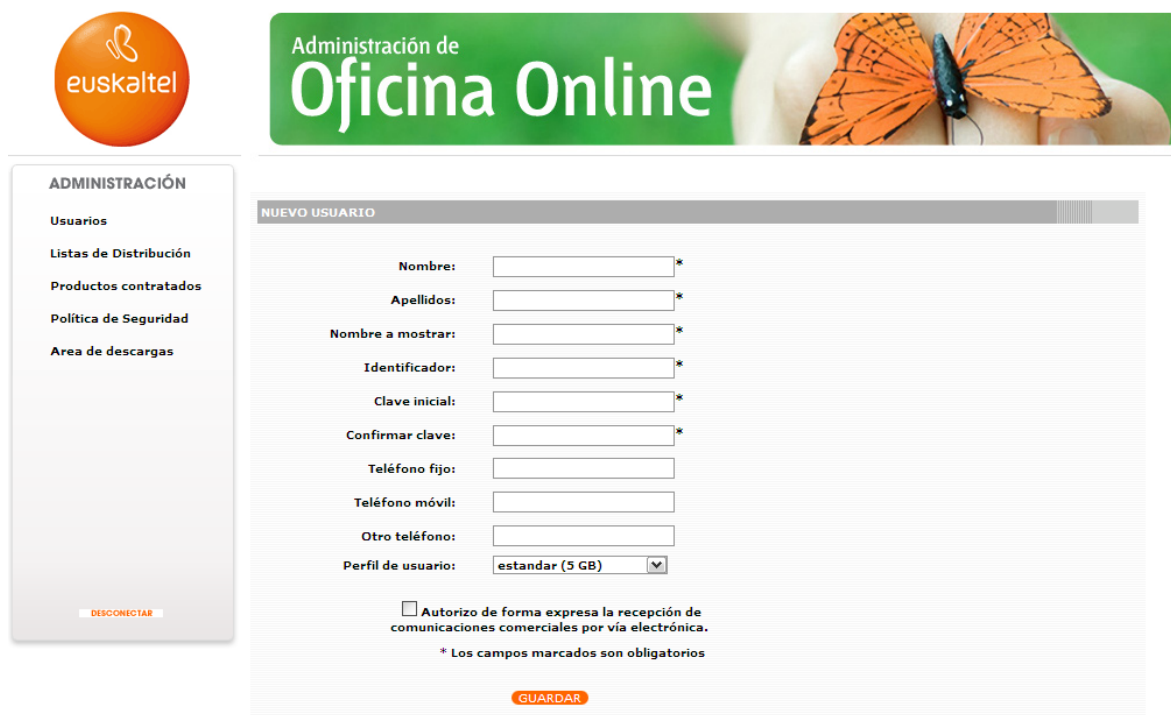
Ilustración 4: Solicitud de datos nuevo usuario