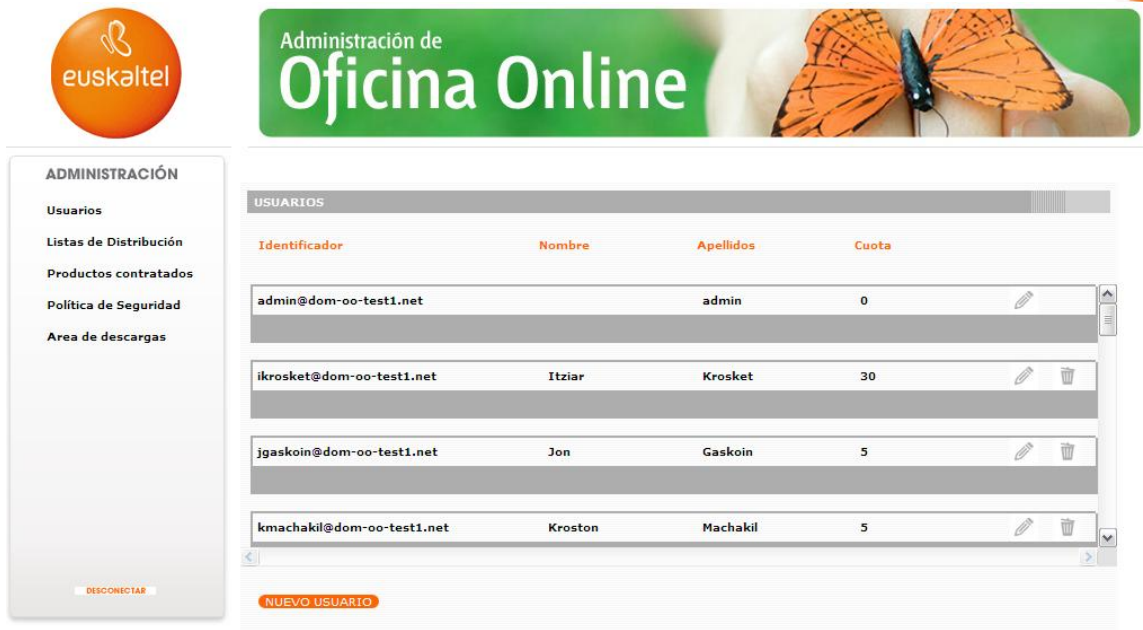
Ilustración 9: Borrado de usuario. Paso1.

Tras realizar dicha acción se muestra una pantalla de confirmación de la eliminación de la cuenta donde se muestran los datos de la misma para identificarla de manera inequívoca.